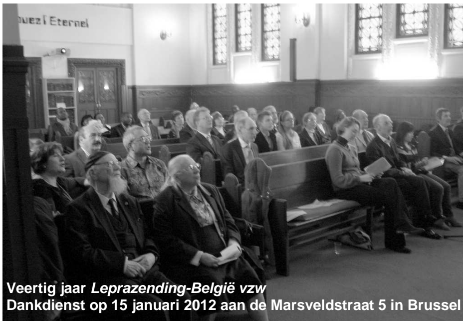
Veertig jaar Leprazending-België vzw Dankdienst op 15 januari 2012 aan de Marsveldstraat 5 in Brussel

Leprazending Nieuw Zeeland: Dank God voor onze afdeling Marketing en Donateurs-service. De medewerkers zijn enthousiast bezig met het opbouwen van betere relaties met donateurs in heel Nieuw Zeeland.